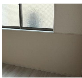
防汚・抗菌の壁紙を採用