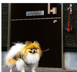
「リードフック」と肉球に優しい「玄関ポーチ」