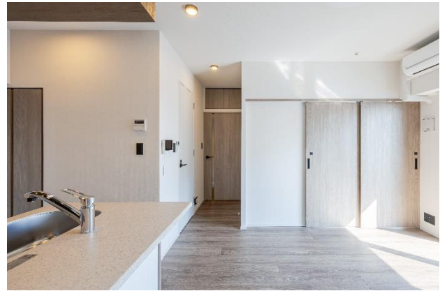
ファミリータイプの住戸