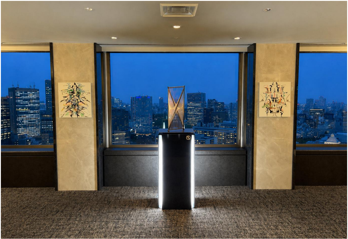
作品「Wrap ped or divided A」、ほか ドローイング作品 2 点 後藤宙