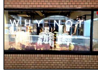
ブランド古着専門店