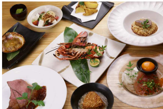
<飲み放題込お一人様 7,000 円コース>