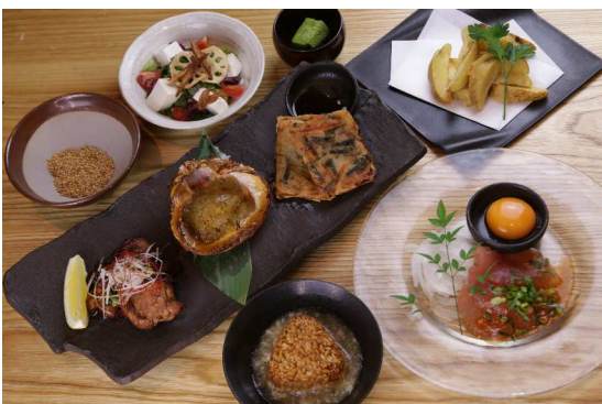
<飲み放題込お一人様 5,000 円コース>