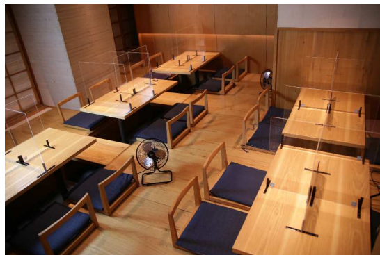
<アクリルパーテーションで仕切られた空間>