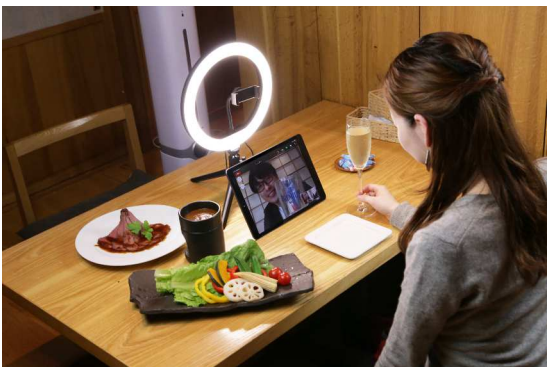
<オンライン飲み会模様>

今後、幹事を務める方には朗報となるバーチャルリアリティを用いた下見サービスも提供予定です。