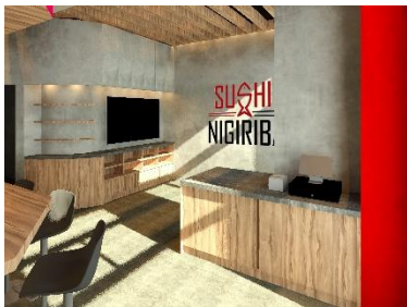
「SUSHI NIGIRIBA」(Huntington Beach)