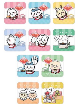
ドリンクご注文特典

三ツ星レストランでHOTな激しい展開でトルティーヤ巻き巻きされた、ちいかわとハチワレを再現!ウイナー、マッシュポテト、チリコンカン、みじん切りにしたピクルスをトルティーヤで巻きました。アクセントをのせて。