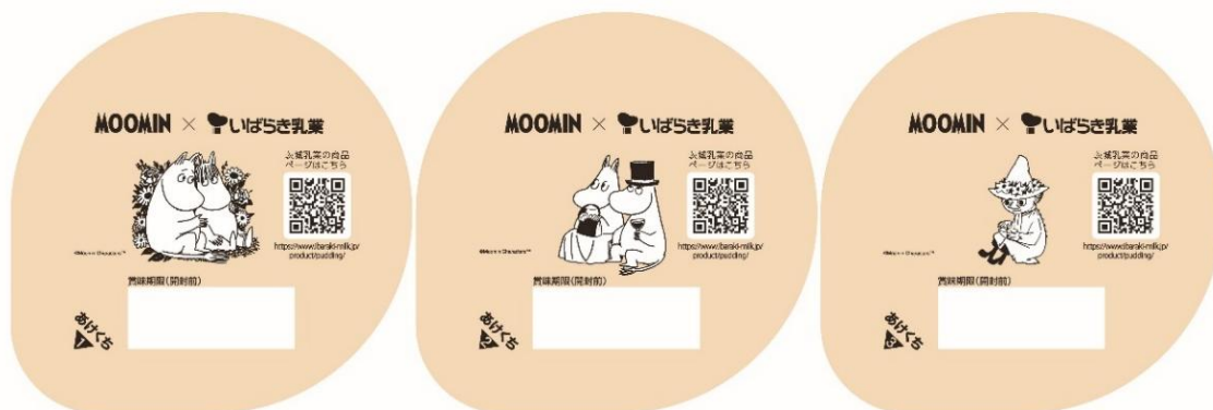
①ムーミントロール&スノークのおじょうさん ②ムーミンパパ&ムーミンママ