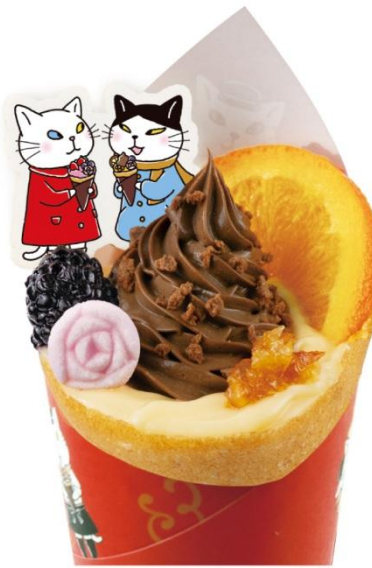
ときめくオレンジショコラ