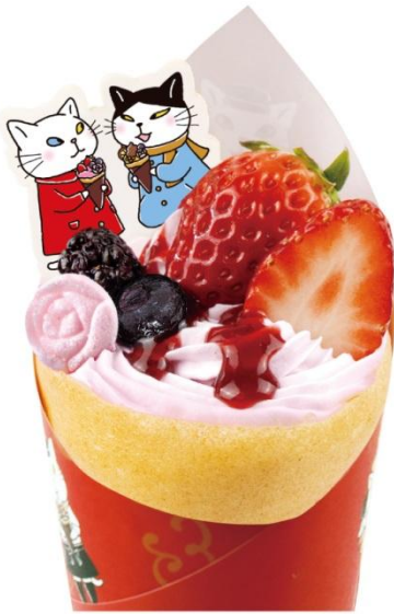
恋するベリーローズ