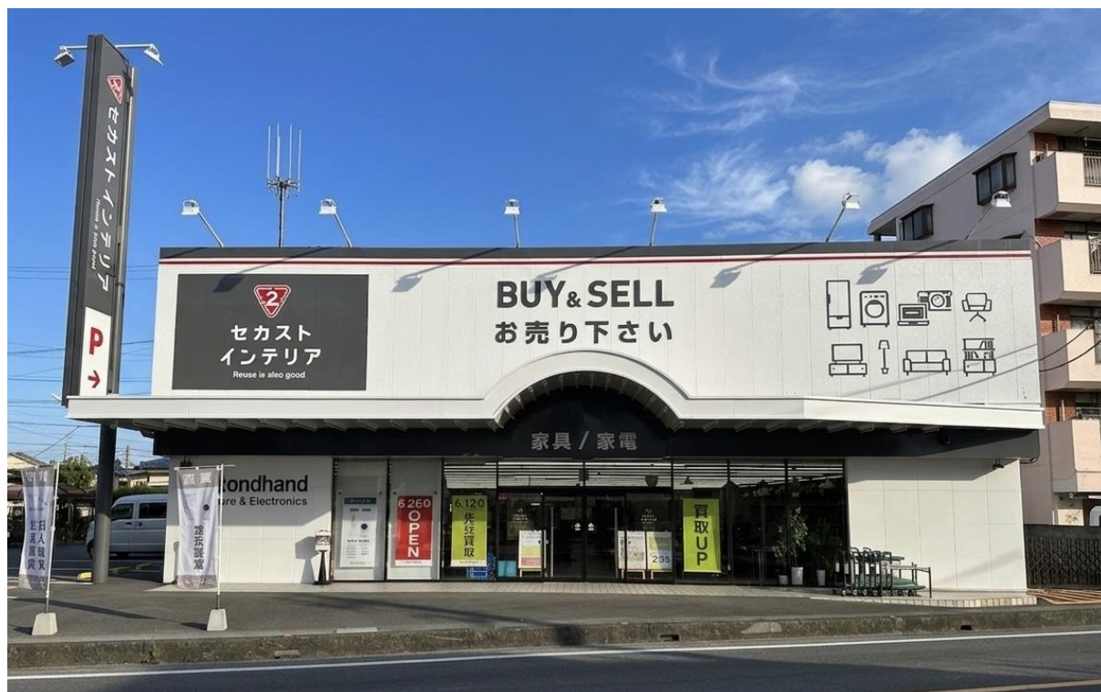
<『セカストインテリア新座片山店』外観>

セカストインテリアは、お気に入りの家具・家電との出会いを通じて、多くのお客さまが理想の生活空間を実現できるようサポートします。今後は、今回の関東初出店を契機として、関東・中部エリアを中心に出店を加速させていく計画です。