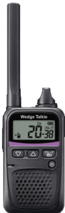
当社オリジナル商品 特定小電力トランシーバー 「Wedge Talkie®」※1

以下が、当社オリジナル商品「Wedge Talkie®」※1 と「Wedge Talkie TR」※2 となります。