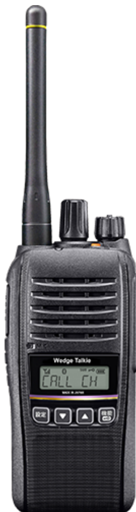
当社オリジナル商品 デジタル簡易無線登録局 「Wedge Talkie TR」※2