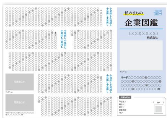
▲『ちいき新聞』記事コーナー掲載イメージ