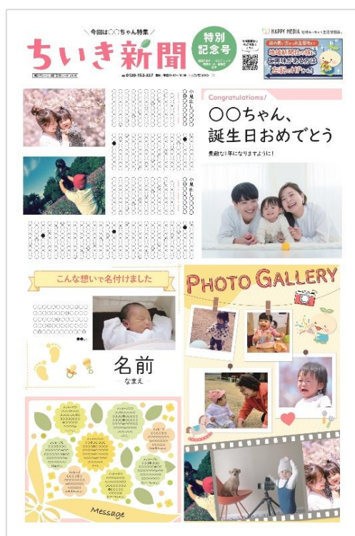
▲「オリジナルちいき新聞」イメージ