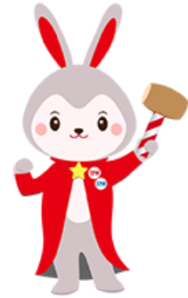
日本M&Aセンター 上市支援サービスキャラクター TIPPY☆多 クッキー

また、2024 年 12 月には福岡証券取引所が運営するプロ投資家向け市場、Fukuoka PRO Market の上市指導・審査を行う F-Adviser 資格を、2026 年 6 月には札幌証券取引所が運営するプロ投資家向け市場、Sapporo PRO Frontier Market の上市指導・審査を行う S-Adviser 資格を取得いたしました。