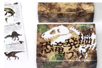
恐竜発掘プリン 「恐竜」×「体験創出」で 地域資産へ