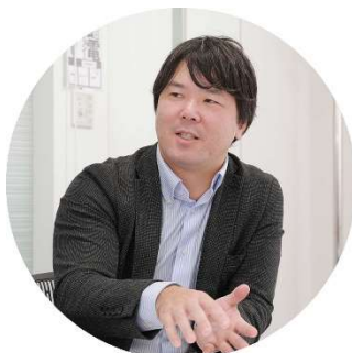
シュンビン株式会社 プロデュース課リーダー