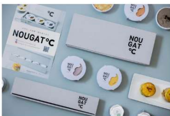
ヌガード おもてなしセレクション 最高金賞受賞