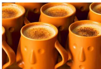
はにわぶりん 発売5年で55万個を販売