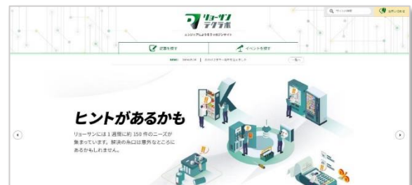
マガジンスイト「リョーサンテクラボ」トップページ

ウェブサイト URL : リョーサンテクラボ | エンジニアによりそうマガジンスイト (techlabo.ryosan)