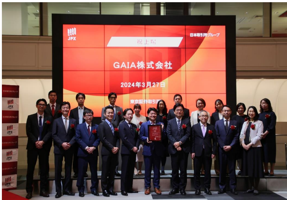
暖かな春の日に東京証券取引所にて上場セレモニーが行われました。会場は同社の社員とご家族の笑顔で溢れました。

当社の連結子会社である株式会社日本 M&A センター(以下、日本 M&A センター)が J-Adviser を担当しておりますGAIA株式会社が、本日、株式会社東京証券取引所(以下、東京証券取引所)が運営する TOKYO PRO Market へ上場いたしましたことを、下記のとおりお知らせいたします。